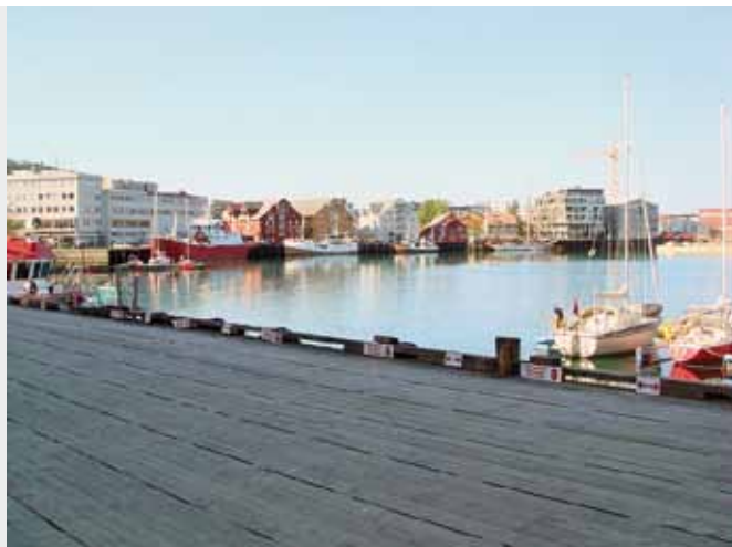
Utsikt från en brygga vid havet ca. kl. 22.00.